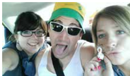
UN ESPRIT D'ÉQUIPE ET DES MOMENTS DE COMPLICITÉ

Arrivés à bon port grâce aux filles, choix des activités par les garçons, excellente harmonie de groupe, des rires et l'impression d'être en famille, c'est juste des moments supers précieux.