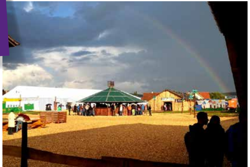
La place de fête sous un arc-en-ciel

Phrase scandée par les deux constructeurs de notre bar à mines, lorsque les dernières fondations de celui-ci se sont effondrées durant les rangements. Phrase qui depuis persiste au sein de notre jeunesse!