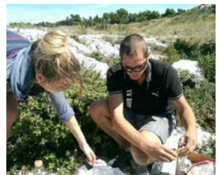
DES PRODUITS DU TERROIR, DU BON VIN ET LA NATURE