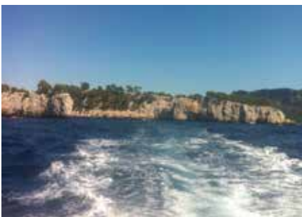
UNE DESTINATION INCONNUE À CHOISIR SUR LE MOMENT EN FONCTION DE L'ENVIE

Rien de réservé, pas de choix de destination, OK il est 22:30 heure du départ – on a envie d'aller à la mer – alors c'est parti!