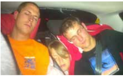
AVOIR DES AMIS CONFORTABLES POUR LES LONGS TRAJETS EN VOITURE