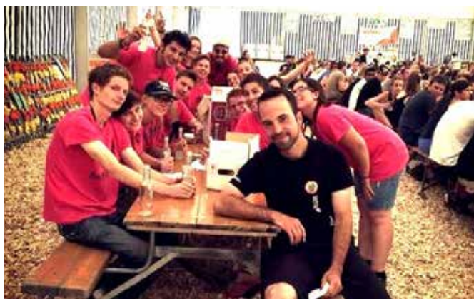
La photos des 16 trolls de Dommartin / Villars-Tiercelin

La jeunesse de Villars-Tiercelin/Dommartin a voulu innover le concept du simple souper du mercredi soir. Elle a préféré vous offrir l'opportunité de (re)découvrir des saveurs de notre canton, servies et présentées par les producteurs mêmes, aux 10 stands installés sous la cantine. Ainsi, plus de 250 personnes ont pu apprécier des mets et des vins de cinq régions vaudoises, accompagnés par le son mélodieux des cors des Alpes.